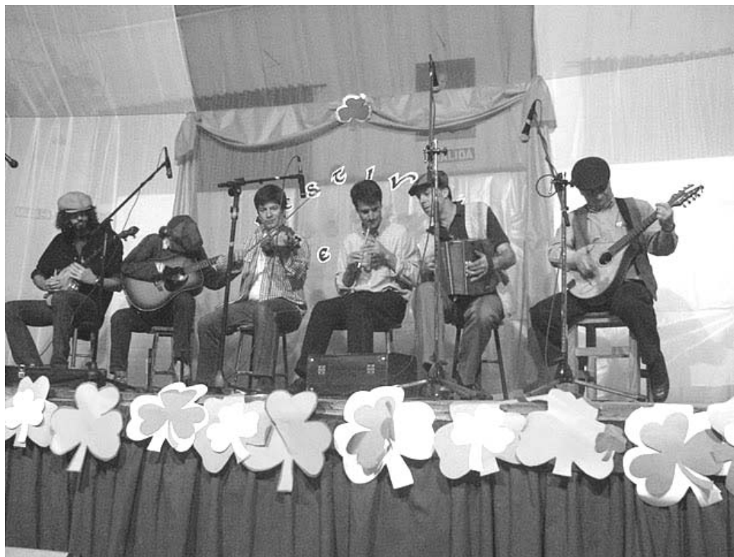
(Evento Celta 2009 en San Pa)

En el mes de junio del año 2003, el Grupo Scout San Patricio se dispone a organizar un gran evento, una novedad para toda la comunidad palotina proveniente de Irlanda. ¡Qué mejor que mostrarle a ellos un Gran Evento Celta! Lleno de bailes, danzas y una espectacular degustación de pizza y cerveza tirada. Tantas actividades lleva un evento cómo estos, que el grupo completo se disponía a la organización del mismo y la distribución de cada tarea que había que cubrir para el gran día, el 21 de ese mismo mes. La venta de entradas anticipadas y la preparación de miles de tréboles para pegar por todos lados y ambientar nuestro salón en un sitio de cálido y amoroso clima irlandés.