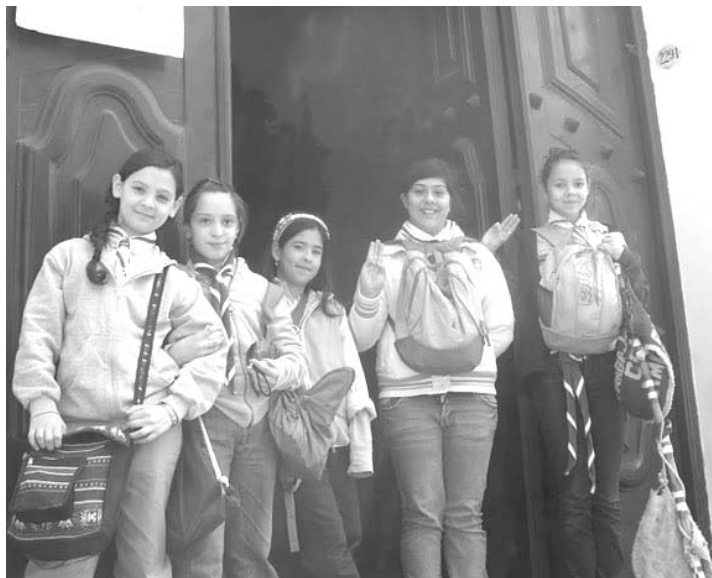
-La Pica en El Museo Larreta-

Luego de un ratito apareció la Orca. Con toda la Comu Scout reunida, todas las scouts se llevaron un tesoro, el mismo que yo me llevé cuando estuve en la Comu Scout, que fue el de ver desde otro punto de vista la ciudad. Cotidianamente uno suele vivir apurado y no pueda tener el tiempo suficiente para apreciar la ciudad y encariñarse con ella, y a mí la búsqueda del tesoro me dio ese tesoro, de ver la ciudad en la que vivimos de otro modo, pasar un lindo momento con las chicas, conocer lugares nuevos y llevarme conmigo muchas anécdotas para guardar.