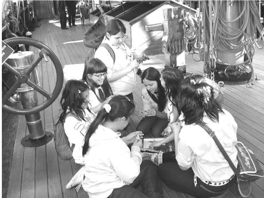
-La Venado y el tesoro-

La Comunidad Scout el sábado 16 de octubre, muy tempranito a la mañana comenzó con su Búsqueda del Tesoro por la Ciudad , llevando junto a ellas una Guía T, comida, una brújula y todas las ganas por encontrar el tesoro.