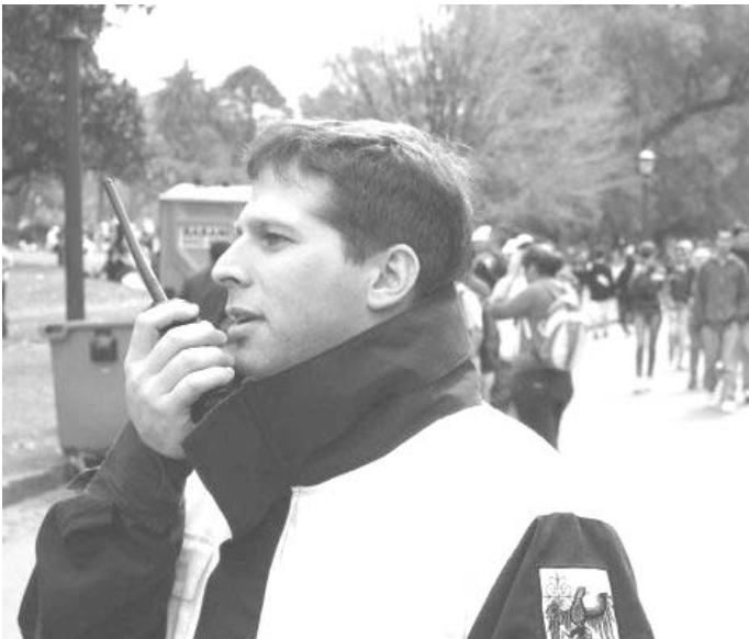
Germán en acción